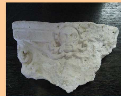
Patrice ou moulage de carreau ?

Dans la technique dite gothique, le moule est chemisé avec l'engobe blanche, procédé qui permet d'accentuer le relief du décor. Le potier-poêlier dispose d'un four pour cuire sa production. C'est lui qui assure le montage et l'entretien du fourneau ou Kachelofen. Il faut de 100 à 250 carreaux selon le modèle. (modèle simple à dôme ou d'apparat de type turiforme).