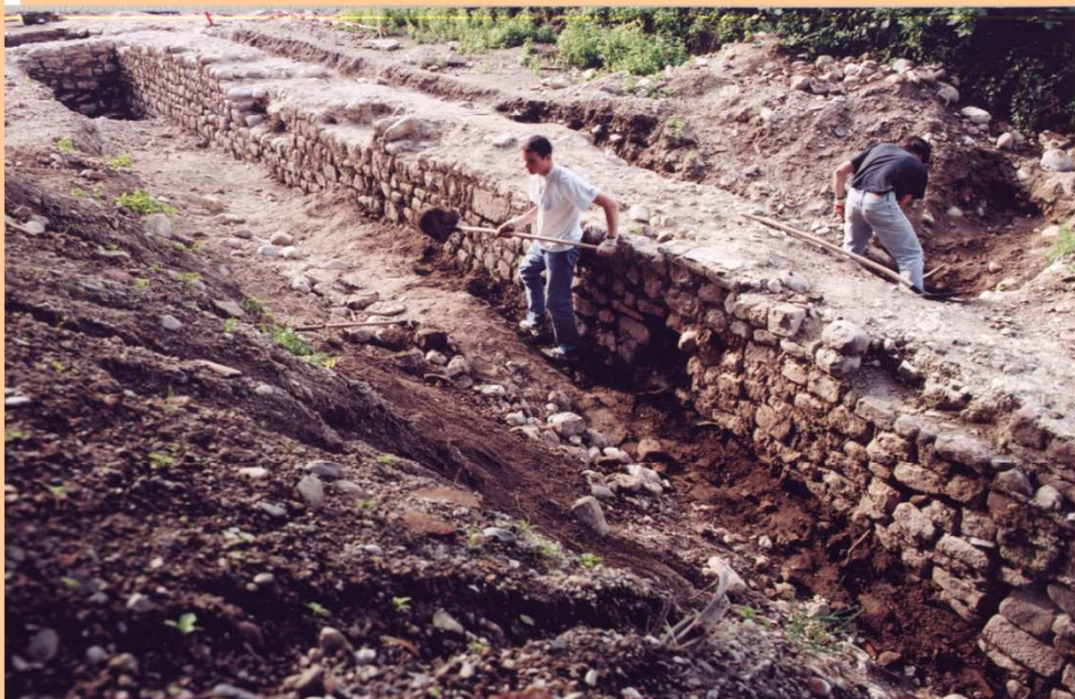
Mur d'enceinte de Cernay (Fouilles 2000)

C'est dans cette zone qu'a été découvert un important mobilier de céramique de poêle. Il s'agit de l'ancien fossé nord de la ville longeant la première enceinte et comblé vers le milieu du XVI e siècle, alors qu'un second mur plus long avait été élevé avant 1417. Ces tessons semblent provenir de l'ancienne maison noble qui jouxtait l'enceinte, ou bien d'un atelier de potier voisin (bien que non localisé à ce jour). Le fossé a aussi livré de la vaisselle courante, en particulier des pots divers en céramique noire, de nombreux restes fauniques, du verre travaillé, et de rares objets en métal (fermoir de livre à morillons, fibule en laiton estampé, ferret de lacet, 1 Vierer de Fribourg en Brisgau (1550) et 1 Rappen de Bâle (1500) (monnaie d'argent).