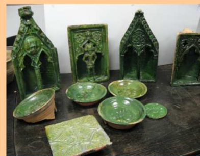
Echantillons de carreaux